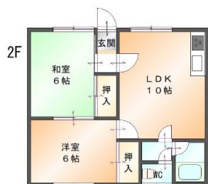
アパート 同間取り 全8戸